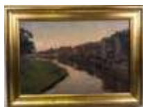
284. Gorm HANSEN (1886- ?). Maisons au bord du canal. Huile sur toile signée en bas à gauche. 38 x 65 cm.