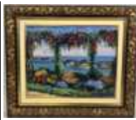
308. Roger-Ambroise LAFONT (XXe). Paysage méditerranéen à la pergola. Huile sur toile signée en bas à gauche. 33 x 41 cm.