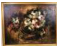
260. Domingo PRIETO (XXe). Bouquet de fleurs. Huile sur toile signée en bas à droite. 73 x 92 cm.