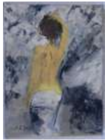
381. Maria TINOCO (XXe-XXIe). Femme de dos devant la montagne. Huile sur toile signée en bas à gauche, titrée, contresignée et datée 2017 au dos. 24 x 18 cm.