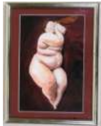
383. Nu endormi. Aquarelle et gouache sur papier. 18 x 24 cm.