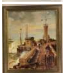
216. H. LECHEVALIER ? (XIXe-XXe). Jour de tempête sur le quai. Huile sur toile signée en bas à gauche et datée 1909. 46,5 x 38 cm.