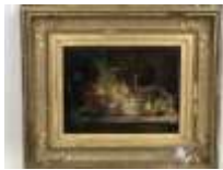
248. Ecole française XIXe. Nature morte aux cuivres et aux légumes. Huile sur panneau signée en bas à droite. 26,5 x 35,5 cm (accidents).