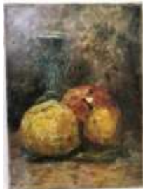
252. E. LEVILLAIN (XXe). Nature morte aux coings. Huile sur toile signée en bas à gauche. 33 x 24 cm.