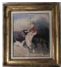
82. Ecole française XXe. La cavalière et le lévrier. Aquarelle. 23 x 19 cm.