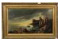
227. Ecole française XIXe-XXe. Bateau près de la fortification. Huile sur toile signée J. JEAN NO... 27 x 46 cm. (enfouissement et restaurations)