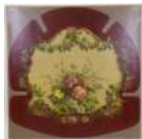
266. Ecole française dans le goût du XVIIIe. Panneau décoratif de fleurs. Toile. 80 x 80 cm.