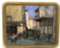
272. P. DOUARD XXe. Vieille rue animée à Tours. Huile sur toile signée en bas à droite, située au dos. 38 x 46 cm.