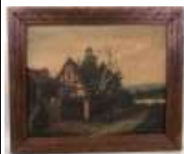
298. BANNER. Campagne nordique. Huile sur toile signée en bas à gauche. 49 x 60 cm.