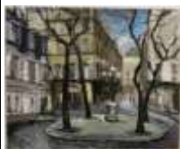
274. École française XXe. Place Furstenberg animée, bouquet de chrysanthèmes. Huile sur toile double face, signée Jean BOUCH ... 50 x 61 cm.