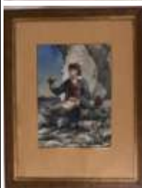
96. RECK (XIXe). La halte du marcheur. Aquarelle signée en bas à gauche. 29,5 x 20,5 cm.