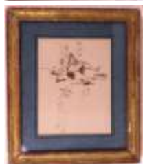
88. Ecole française XIXe-XXe. Etude d'homme au verre. Encre et lavis. 21 x 16 cm.