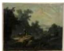
270. Ecole italienne début XIXe. Troupeau et bergers près de la cascade. Huile sur toile. 48 x 59 cm. (petits accidents).