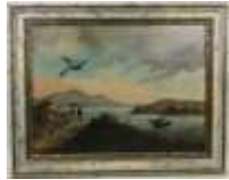
301. École naïve XIXe. Paysage lacustre aux grands oiseaux. Huile sur toile marouflée sur panneau. 50 x 65 cm.