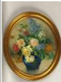
257. Gustave Joseph DUBOUCHET (1867-?). Bouquet de roses et lilas. Huile sur panneau de forme ovale signée en bas à gauche. 46 x 38 cm. (cadre très accidenté après la photo -> vendu sans cadre).