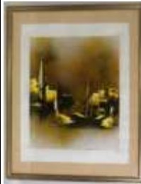
344. École française XXe. Venise. Encre grasse et aérographe, signée en bas à gauche. 44 x 34 cm.