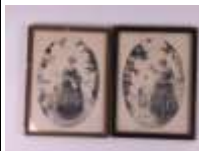
29. Max CRAUSAZ d'après (1885-?). Femme au lévrier et les bulles de savon. Deux gravures en couleurs de forme ovale, signées en bas à droite. 23 x 15,5 cm.