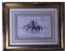
85. Ecole française XXe. Les jockeys. Dessin au fusain monogrammé en bas à gauche GG. Avec envoi en bas à droite "à mon vieux camarade ...". 16 x 24 cm. (pliures).