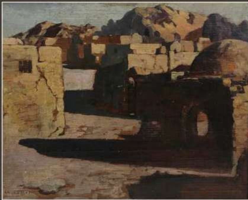
181. Ch. COTTET