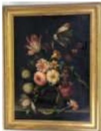
253. Ecole française XXe dans le goût du hollandais du XVIIe. Vase de fleurs sur entablement. Huile sur toile. 55 x 41 cm.