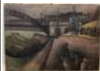
297. École de l'Est XXe. Sur les quais. Huile sur toile non signée. 54 x 73 cm. (accidents).