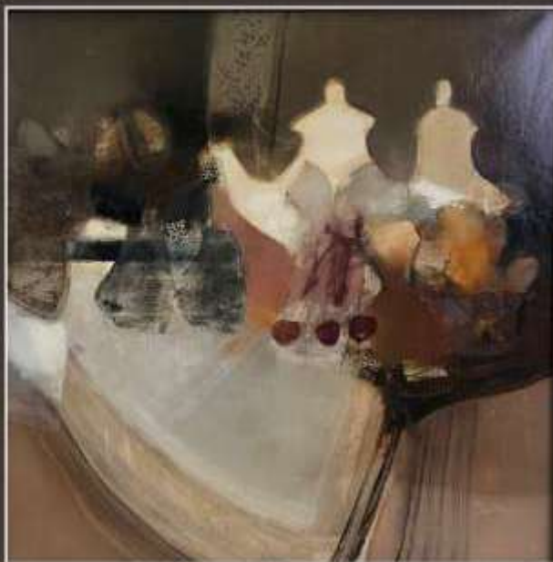
354. J-J BALITRAN