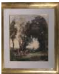
94. Ecole française XIXe. La danse. Aquarelle. 52 x 42 cm.