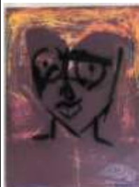
349. MAXIME XXe-XXIe. Calme mental, force du coeur. Huile sur toile signée en bas à droite, titrée au dos et datée 2009. 81 x 60 cm.