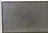
390. PR XXIe. Motif floral. Feutre sur papier, signé dans le motif. 60 x 40 cm.