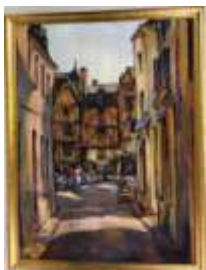
319. École française XXe. Tours, le Vieux Murier. Huile sur toile, titrée au dos. 80 x 60 cm.