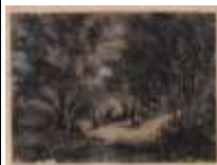
91. Ecole française XIXe-XXe. Le camp de forains. Dessin au fusain. 30 x 40 cm.