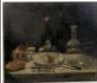
255. B. ESNAULT (XIXe). La cloche de fromage. Huile sur panneau signée en bas à droite. 46 x 55 cm. (accidents).