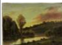
228. Ecole française XIXe-XXe. Sur la rivière. Huile sur toile signée en bas à droite LV PONS ? 33 x 46 cm.