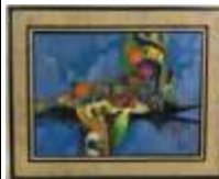
348. J. FAIFER XXe-XXIe. La vie en bleue. Huile sur toile signée en bas à droite. 46 x 51 cm.