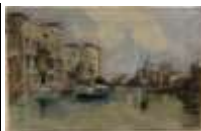
273. GUISE (XXe). Vue de Venise. Huile sur toile signée en bas à droite, datée 1938. 37 x 58 cm.