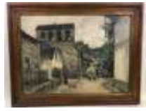
302. AM LE PETIT (XXe). Paysage à Gimel en Corrèze. Huile sur toile signée en bas à droite, située au dos et datée 1933. 50 x 65 cm.