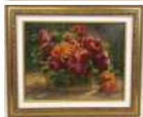
267. Oliver MARECHAL (XIXe-XXe.). Bouquet de fleurs dans un panier d'osier. Huile sur panneau, signée en bas à droite. 32 x 40 cm.