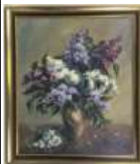
258. G. EVRARD (XXe). Nature morte au lilas. Huile sur panneau signée en bas à gauche. 65 x 54 cm.