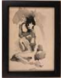
382. CONAZO (XXe-XXIe). Nu. Encre et lavis signée en bas au centre. 17 x 12.5 cm.