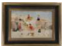
321. CAUDRY (XXe). Études d'enfants. Huile sur panneau, attribuée sur la cadre au dos. 16 x 24 cm.