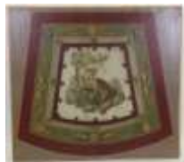
265. Ecole française dans le goût du XVIIIe. Le loup pris au piège. Toile. 68 x 74 cm.