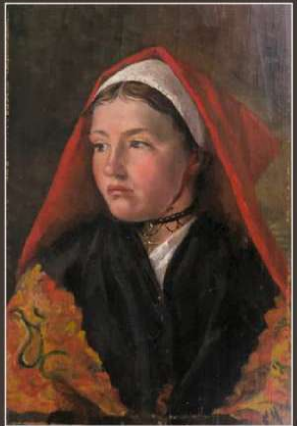
208. Ecole provençale XIXe.