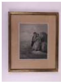
16. Gustave DORÉ (1832-1883). Tircis et Amaranthe d'après PANNEMAKER. Gravure en noir. 24 x 19 cm.