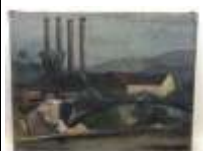
296. École de l'est XXe. Paysage industriel. Huile sur toile signée en bas à droite Angéla PETRISCOU (?). 54 x 73 cm. (accidents)