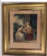
95. Ecole française XIXe. Au jardin. Aquarelle d'après Charlemagne Oscar GUET. Avec envoi en bas à gauche. 30 x 25 cm.