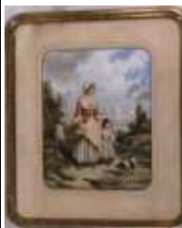
97. L. HERVÉ (XIXe). La promenade au chien. Aquarelle signée en bas à droite. 35 x 28 cm.