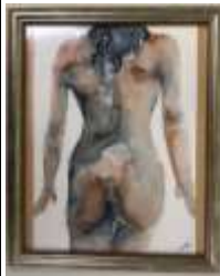
386. L. SILVEV XXIe. Nu de dos. Aquarelle signée en bas à droite. 29 x 21 cm.