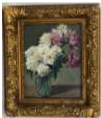
251. Albert LACOUT (XXe). Vase de pivoines. Huile sur toile signée en bas à droite. 35 x 27 cm. (restauration).