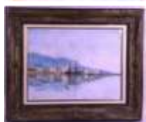
89. Ecole française début XXe. Grands voiliers devant la digue. Aquarelle signée en bas à droite PETRINE (?), située en bas à gauche et datée "oct. 04". 26 x 34 cm. (taches).