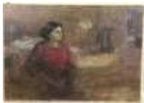
336. Gérard RIGOT XXe. Jeune femme dans son intérieur. Huile sur toile signée en bas à droite. 65 x 92 cm.