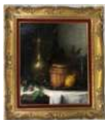
286. Léon-Auguste TOURNY (1835-?). Nature morte au citron. Huile sur toile signée en bas à droite et datée 1882. 55 x 46 cm. (accidents et restaurations)