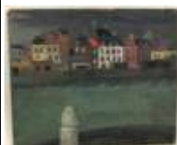
174. Jeanne LANGLOIS BELLOT (XXe). Sur le port. Huile sur carton non signée. 38 x 46 cm. (accidents).