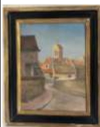
224. Ecole française XXe. Village au soleil. Huile sur panneau signée en bas à droite G. LETRILLARD, datée 1893. 25 x 19 cm.