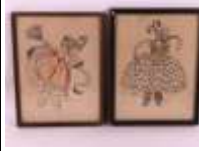
31. DOUKY (XXe). Deux extravagantes. Deux gravures en noir rehaussées à l'aquarelle, signées à gauche et à droite. 28 x 21 cm. (mouillures).