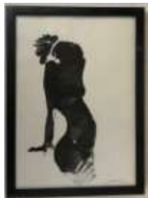
385. SANTY (XXIe) Nu. Encre signée en bas à droite. 29 x 20 cm.