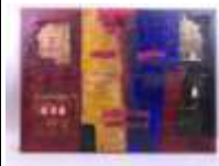
347. Manuela DIKOUME (1956-). Les sept portes. Acrylique sur toile signée en bas à droite et titrée au dos, datée IX-2006. 50 x 71 cm.