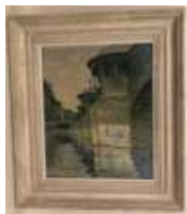
214. Y. DAVID (XXe). Le Pont-Neuf. Huile sur carton signée en bas à gauche. 46 x 38 cm.