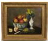
250. Ecole française XIXe. Nature morte au pot en Canton et aux fruits. Huile sur toile. 33 x 41 cm.