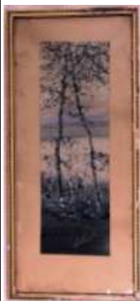
93. Ecole française XXe. Les bouleaux au printemps. Aquarelle et gouache. Trace de signature en bas à droite. 47 x 15 cm.