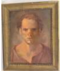
323. École française XXe. Portrait d'homme. Huile sur toile. 35 x 25 cm.