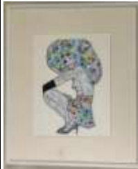
389. Camille ROODGOLI (XXIe). Lila. Technique mixte sur papier, signée en bas à droite et datée au dos "31/01/2019". 31 x 23 cm.