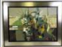
345. FAULLIN. Composition, abstraction lyrique. Acrylique sur toile signée en bas à gauche. 50 x 70 cm.