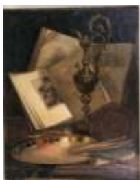
254. Ecole XIXe. Alégorie de la peinture. Huile sur toile datée 1904. 74 x 58 cm. (accidents).