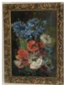
282. E. ALEXANDRE (XIXe-XXe). Jetée de fleurs des champs. Huile sur toile signée en bas à droite. 46 x 33 cm.