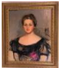
306. École française XXe. Portrait de femme aux fleurs. Huile sur toile signée en haut à gauche. 65 x 54 cm. (accidents).