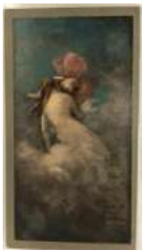
340. École française début XXe. Jeune femme et un amour dans une nuée. Huile sur ancien panneau publicitaire. 105 x 58 cm.