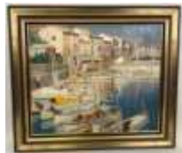
162. SCHILD (XIXe-XXe). Port méditerranéen. Huile sur toile signée en bas à gauche et datée 1931. 57 x 68 cm.