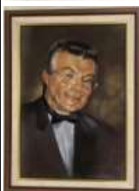
329. École française XXe. Portrait d'homme au noeud papillon. Pastel, trace de signature en bas à droite. 54 x 37 cm.