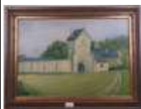
277. Marius FOURMONT (XXe). La Grange de Meslay. Huile sur toile signée en bas à droite. 38 x 55 cm.