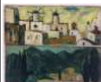
175. Jeanne LANGLOIS BELLOT (XXe). Moulin en Grèce et Paysage. Deux huiles sur panneau, une signée en bas à gauche. 22 x 55 cm (x2). (accidents).