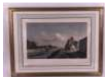
21. École française XVIIIe, gravé par SCHIMTZ en 1779. Vue de l'Arsenal et du magasin à poudre. Gravure en noir rehaussée. 24,5 x 36,5 cm.