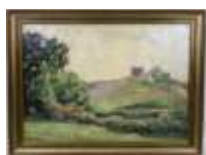
288. Marie-Thérèse BRUNET-LOTTER (1889-?) Maisons sur la dune. Huile sur panneau signée en bas à gauche. 52 x 70 cm.