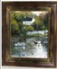
309. A. BEL (XXe). Barques dans la ria. Huile sur toile signée en bas à droite. 41 x 33 cm.