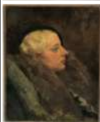
327. École française, vers 1930. Femme au béret. Huile sur toile. 41 x 33 cm.