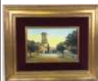
281. DEVE. Le Suquet à Cannes. Huile sur toile signée en bas à droite. 27 x 41 cm.