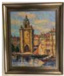
299. E. ROSENBERGER. Entrée du port de La Rochelle. Huile sur toile signée en bas à gauche. 51 x 41 cm.