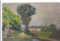
170. Ecole française XIXe. Paysage de campagne. Huile sur carton. 18 x 27 cm.