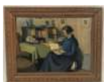
219. Ecole française début XXe. Femme à la lecture. Huile sur panneau. 19,5 x 27 cm.