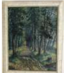
215. Ecole française XXe. Chemin forestier. Huile sur isorel signée en bas à gauche, datée 51. 47 x 36,5 cm.