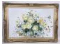
269. EDWARD (XXe). Bouquet de fleurs. Huile sur toile signée en bas à droite. 61 x 91 cm.