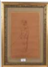
90. Ecole française XXe. Le jeune humilié. Dessin à la sanguine. Trace de signature en bas à droite. 37 x 23 cm. (vitre cassée).