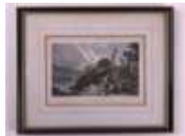
18. T.M. BAYNES. Dartmouth castle. Gravure en noir rehaussée. 9 x 15 cm.