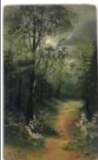
229. R. LELAN (début XXe). Le sous-bois au clair de lune. Huile sur carton signée en bas à gauche, contresignée au tampon au revers. 27 x 16 cm.