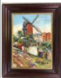
275. École française XXe. Le moulin rouge. Huile sur panneau signée MACLET en bas à droite. 46 x 33 cm.