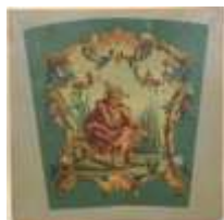
264. Ecole française dans le goût du XVIIIe. Le pêcheur. Toile. 45 x 45 cm.