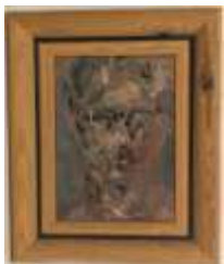
324. Liliane E. WHITTEKER (XXe). Portrait d'homme. Huile sur toile non signée. 33 x 24 cm. On y joint un carton d'exposition de novembre 86.