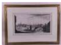
22. I. SILVESTRE. Vue du Pont Neuf et de l'Isle du Palais. Gravure en noir par PERELLE à Paris. 20 x 34,5 cm. (pliures, déchirures).