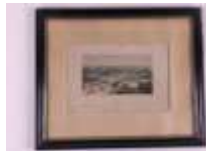
19. Auguste DEROY d'après. Vue générale de Tours. Gravure en noir, gravée par LEMERCIER à Paris. 9 x 15,5 cm. (rousseurs).