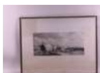
24. École française XIXe. Entrée au port d'Alger. Gravure en noir. 20 x 44 cm.