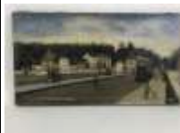
230. VERGNOL (XIXe-XXe). Vue du Pont de Pierre à Tours. Huile sur toile signée en bas à droite, datée 1903, titrée en bas à gauche. 24 x 45 cm. (accidents, faiçençage).