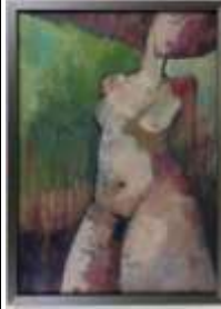
387. École contemporaine. Nu. Gouache sur papier. 28.5 x 20 cm.