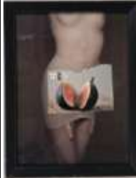
388. Désir. Collage. 23 x 17 cm.