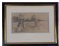
86. Ecole française dans le goût des impressionnistes. Aux champs. Dessin au fusain. 12 x 22 cm.