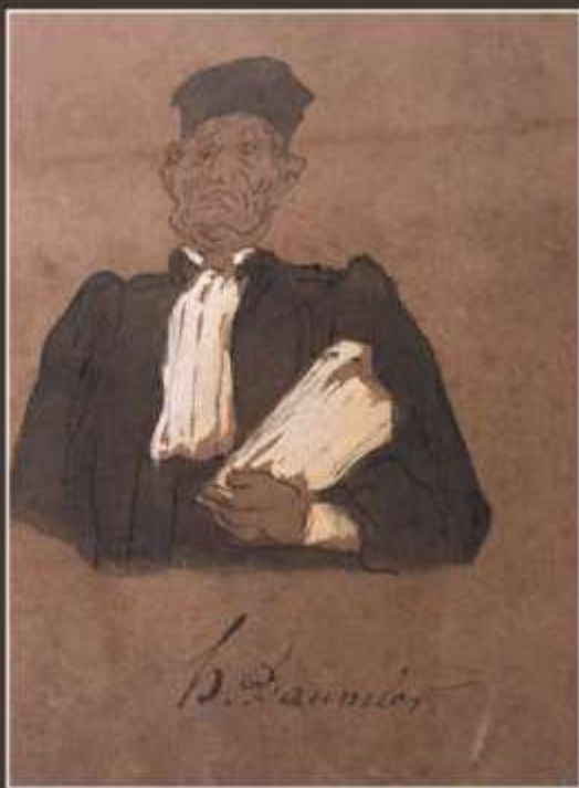
98. H. DAUMIER (Att. à)