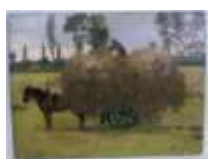
220. Ettore BRUNINI (XIXe-XXe). Paysanne à la charrette de foin. Huile sur panneau signée en bas à droite, titrée "En Touraine" au dos. 26,5 x 35 cm. (petit manque en bas à droite).