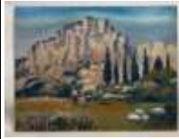
311. René DECAMP (XXe). Paysage provençal animé. Huile sur panneau, non signée. 51,5 x 65 cm. (fente en bas à droite et petits manques)