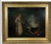
292. L. FERY (XIXe). Le chaudron. Huile sur toile signée en bas à droite. 58,5 x 72 cm.