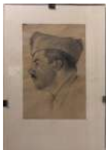
84. Ecole française vers 1940. Profil de militaire, porte une signature L. DUCAR (?) à droite, titrée Camp d'Anthony et datée 27/8/1940. 22,5 x 14,5 cm.