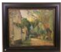
287. G. FRANCOIS (XXe). L'allée ombragée, les huttes. Huile sur panneau double face signée en bas à droite. 45 x 54 cm. (accidents).