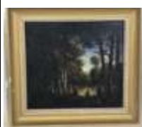
226. Ecole française XIXe. Femme et enfant en sous-bois. Huile sur panneau. 19 x 21 cm.