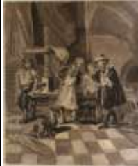
310. École française XXe, dans le goût de l'ancien. Chez l'imprimeur. Huile sur panneau. 55 x 46 cm.