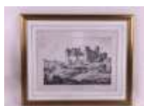
23. C. BOURGEOIS. Vue du château de Luynes. Gravure en noir par DELPECH. 22 x 31 cm. (rousseurs).