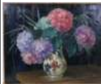
259. École française XXe. Bouquet d'hortensias Huile sur toile signée GETTHOY. 60 x 70 cm. (restaurations, accidents).