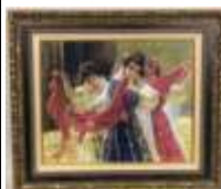
179. Goran Sherif LATIF (1968-). La danse orientale. Huile sur toile signée en bas à gauche. 38 x 46 cm