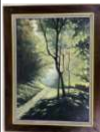
278. École française XXe. Sous-bois ensoleillé. Huile sur panneau signée en bas à droite A. GEORGET. (?). 53 x 38 cm.