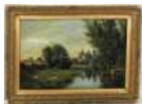
271. Edmond GAUTIER (XIXe). Vue de Loches. Huile sur carton, signée et datée 1881 en bas au centre. 35 x 51 cm.