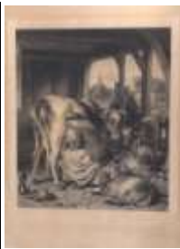
25. École anglaise XIXe. La traite du soir. Grande gravure en noir, datée en partie haute 1862, publiée à Londres par HENRY. 72, 5 x 61 cm. (mouillures, tendue sur châssis de bois).