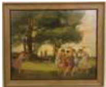
339. École début XXe, d'après COROT. La Danse des Nymphes. Huile sur panneau signée en bas à gauche et datée 1920. 53,5 x 65 cm.