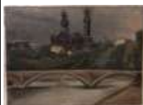
295. École de l'Est XXe. Paysage au pont et à la grande église. Huile sur toile signée en bas à droite Angéla PETRISCOU (?). 54 x 73 cm.