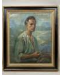
307. Émile LAFAYE (XXe). Autoportrait de l'artiste. Huile sur toile signée en bas à droite et datée 1948. 65 x 54 cm. (rentoilage, accidents et toile détendue).