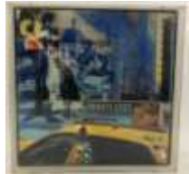
384. Cédric BOUTEILLER (né en 1970). Rue New-Yorkaise. Technique mixte signée en bas à droite présentée dans un cadre en plexiglas. 31 x 31 cm.