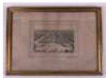
20. BOURGERIE. Château de Richelieu. Gravure en noir rehaussée par CLAREY- MARTINEAU à Tours. 16 x 22 cm.