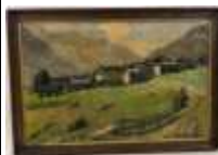
276. R. GIRARD. Paysage de montagne. Huile sur toile signée en bas à droite. 36 x 55 cm.