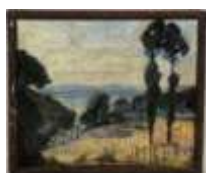
285. O. TASSAERT (XXe.). Paysage vallonné. Huile sur panneau signée en bas à gauche. 46 x 55 cm.