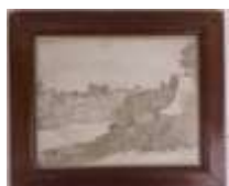
87. Ecole française XVIIIe. Paysage à la falaise et au château. Encre et lavis.