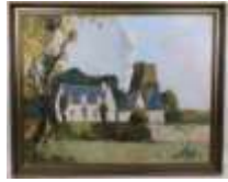
300. Marcel LAVOLLÉE. La Bechellerie. Huile sur toile signée en bas à droite. 64 x 80 cm.