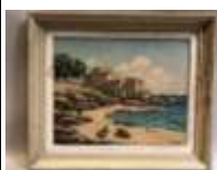
171. Gaston AUBERT (XIXe-XXe). Maisons sur la côte en Méditerranée, à Sanary. Huile sur toile signée en bas à droite. 33 x 41 cm. (déchirure).