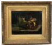
249. Ecole française XIXe. Nature morte à la brioche et au livre. Huile sur panneau. 27 x 35 cm.