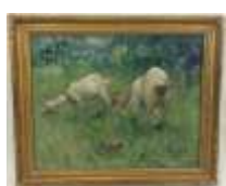
218. Ecole française début XXe. Les deux biquettes. Huile sur panneau. Au dos une étiquette d'une vente de 1927 à Marseille. 22 x 27 cm.