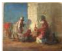
178. École orientaliste XXe. Les fumeurs arabes près de la fortification. Huile sur carton portant une signature brûlée au revers. 13 x 15,5 cm.