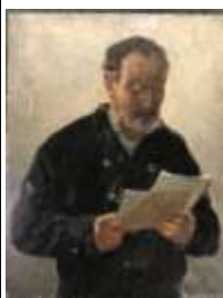
331. Alfred STEVENS (1823-1906). Homme lisant. Huile sur panneau signée en bas à droite. 24 x 18 cm. (accidents).