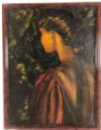
338. FLAURE. Portrait de jeune femme. Huile sur toile signée en bas à gauche. 81 x 60 cm On y joint une estampe originale numérotée représentant un visage de femme.