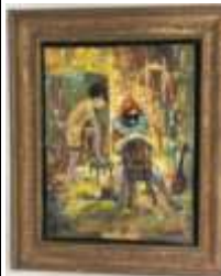
325. École française XXe. Arlequin. Huile sur toile signée FAGER en bas à droite. 35 x 27 cm.