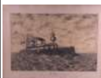
92. A. PERVEAUX (premier quart du XXe). Le Condé, cuirassé d'escadre. Dessin à la mine de plomb signé en bas à droite. 42,5 x 63,5 cm. (petits accident, manques et rousseurs).