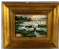
373. F. HUBERT (XXe-XXIe). Les canards. Huile sur panneau signée en bas à droite. 12 x 17 cm.