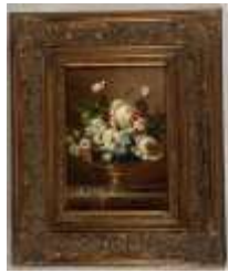
360. R. CAVINO (XXe). Composition florale. Huile sur toile signée en bas à droite. 16 x 13 cm.