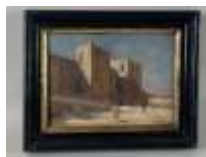
313. J. DEJEUMA. L'entrée de la forteresse. Huile sur carton signée en bas à droite, datée 20. 17 x 24 cm.