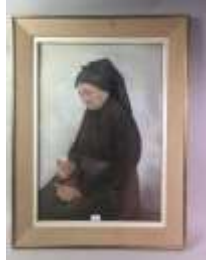
212. Paule MARIE (XXe). La femme au mortier. Fusain et pastel signé en bas à droite, situé à Tolède et daté 1964. 75 x 52 cm.