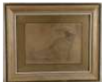
198. Ecole française début XXe. La sieste. Dessin à la mine de plomb. Signature non déchiffrée en bas à droite, daté 21 juin 1903. 29 x 40 cm.