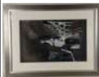
588. WAKHEVITCH (XXe-XXIe). Composition aux ruines. Fusain et pastel signé en bas à droite. 54 x 34 cm.