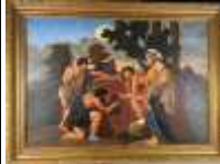
584. Louis VIEULLE (XXe). Les bergers d'Acadie d'après Nicolas POUSSIN. Huile sur panneau signée au dos, datée 8 XII 61 avec envoi. 83 x 120 cm.