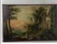
321. Ecole française XIXe. Paysage animé aux ruines. Huile sur toile. Porte une étiquette au dos CLAUDOT et une date 1897. 62 x 90 cm. (accidents).