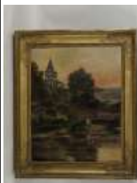
322. E. HERMAND (XIXe-XXe). Le château au bord du lac. Huile sur toile signée en bas à droite. 40 x 32 cm.