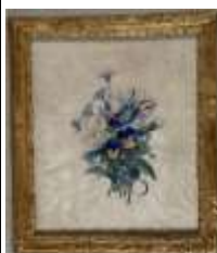
225. Ecole française XIXe. Bouquet de fleurs. Aquarelle. 31 x 26 cm.