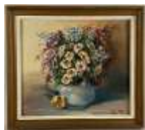
464. Pierre PETIT (XXe). Vase de fleurs. Huile sur panneau signée en bas à droite. 38 x 45 cm.