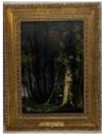
255. Ecole française XIXe. Femme en sous-bois. Huile sur panneau. 35 x 25 cm.