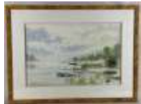
197. BEYER (XXe). Bord de Loire Aquarelle signée en bas à gauche. 32 x 50 cm.