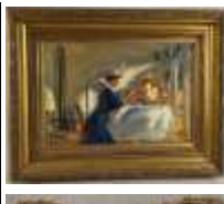
473. O. MIR (XXe). Le déjeuner ensoleillé. Huile sur toile signée en bas à droite. 38 x 54 cm.