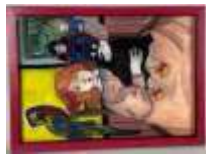
573. Nathalie ROUX (1963-). Fillette et sa poupée. Pastel monogrammé en bas à droite. 41 x 28 cm.