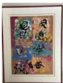
521. ALIX (XXe-XXIe). Composition. Technique mixte sur papier signée en bas à gauche. 69 x 50 cm.