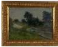
266. Ecole française XXe. Paysage à la rivière. Huile sur carton. 17 x 23 cm.