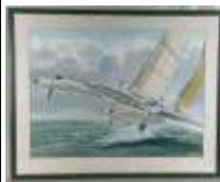
205. G. MALLET (XXe). Catamaran PRIMAGAZ. Aquarelle gouachée signée en bas à droite. 53 x 72 cm.