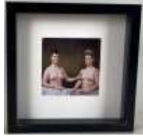
571. Philippe LUCCHESI (XXe). Gabrielle d'Estrées et une de ses sœurs. Tirage photographie (digigraphie) numéroté 2/9 et daté 2019. Certificat d'authenticité fourni par le photographe collé au dos. 13 x 13 cm