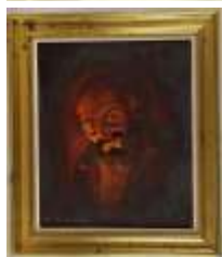
467. A. DE BARROS (?) (XXe). Rouge fumée. Huile sur toile signée en bas à gauche. 46 x 38 cm.