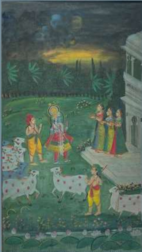
286. Ecole indienne XXe. La visitation. Peinture sur toile.