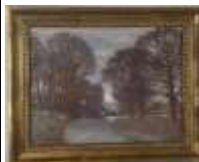
268. Ecole française XXe. Sur le chemin. Huile sur panneau. Trace de signature en bas à droite. 20 x 26 cm.