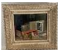
377. J. ROUX (XXe). Nature morte. Huile sur panneau signée en bas à droite portant au revers une étiquette d'exposition du salon de la société des arts du Forez de 1943. 37 x 45 cm.