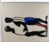
527. ANTONUCCI (XXe-XXIe). L'entretien. Acrylique sur papier marouflée sur toile, datée déc. 2000 et signée au dos. 73 x 60 cm.