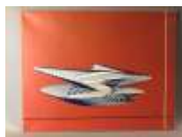
520. BECOOL, Bernard COOLEN dit, (XXe-XXIe). Les années 2000. Tirage en couleurs sur toile signée en bas à droite. Epreuve d'artiste numérotée en bas à gauche. 70 x 90 cm.