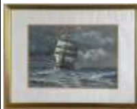
221. H. SASSE (XXe). Trois-mât faisant route vu de face. Aquarelle signée en bas à droite, datée 46. 20 x 27,5 cm.