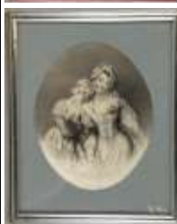
227. Juliette BELLANGER (XIXe). Portrait d'une mère et sa fille. Dessin à vue ovale, signé et daté 1879 en bas à gauche. 23,5 x 19 cm. (rousseurs).