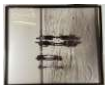
578. ALEX (XXe-XXIe). Marée basse. Tirage photographique signé en bas à gauche. 122 x 100 cm.