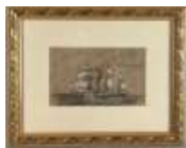
216. Ch. BONNEMAISON (XXe). Bâtiment mixte faisant route. Dessin au fusain et rehauts de gouache, monogrammé en bas à gauche. 10 x 16 cm.