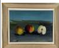
529. TRAVERT(XXe). Nature morte aux pommes. Huile sur toile signée en bas à gauche et datée 1963. 46 x 61 cm.