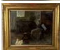
476. Ecole française XIXe. Femme au rouet. Huile sur carton portant une signature "GUELDRY" en bas à droite. 46 x 55 cm.