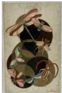
519. Jeanne LARROQUE (XXe-XXIe). Le bal des insectes. Technique mixte sur velours signée en bas à droite, titrée au dos. 80 x 50 cm.