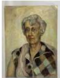
366. MARCHAL (XXe). Portrait de femme. Huile sur panneau signée en bas à droite. 65 x 48 cm. (accidents).