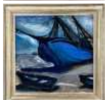
522. Ecole moderne XXe. Barque bleue. Huile sur panneau signée en bas à droite. 50 x 50 cm.