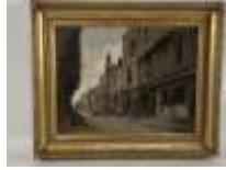
311. Ecole française XIXe. Rue animée. Huile sur panneau située à MONTFERRAND et datée 1896. 32 x 41 cm.