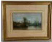
203. Ecole française XIXe. Au bord de la rivière. Pastel signé en bas à gauche. 18 x 30 cm.