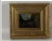
320. Ecole française XIXe. Personnage dans un paysage. Huile sur panneau. 16 x 11 cm.