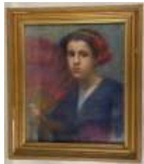
211. L. VARON (XXe). Jeune fille à l'éventail. Pastel signé en haut à gauche. 53 x 45 cm.