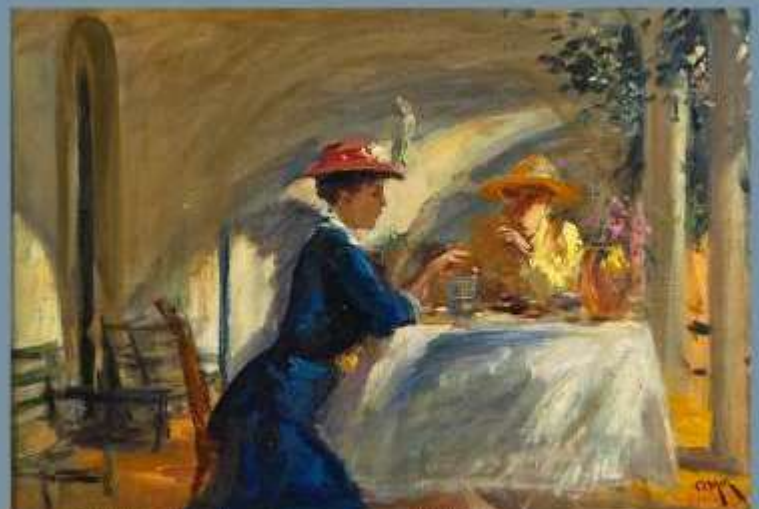
473. O. MIR (XXe). Le déjeuner ensoleillé. Huile sur toile signée en bas à droite.