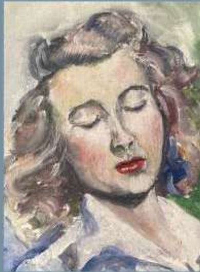
367. H. LUCHAIR (?) (XXe). Portrait de femme. Huile sur toile signée en bas à droite.