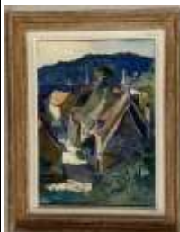
223. Pierre ROBLIN (XIXe-XXe). La rue du village. Aquarelle et rehauts de gouache, signée en bas à droite. 45 x 32 cm.