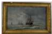
314. Ecole française XIXe. Bâtiment français mixte faisant route. Huile sur toile. 24 x 40 cm. (accidents).