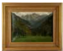
262. Ecole française fin XIXe. Paysage de montagne. Huile sur toile. 29 x 39 cm. (restaurations).