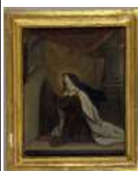
273. Ecole française XIXe. Religieuse en prière. Huile sur toile marouflée sur panneau. 23 x 18 cm.