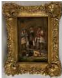
474. Ecole italienne XIXe. Musiciens piémontais. Huile sur toile posée sur panneau. 27 x 18 cm.