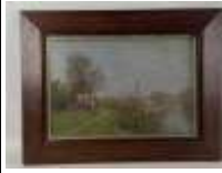
323. A. SAURAN. Bord de rivière. Huile sur panneau signée en bas à gauche. 33 x 48 cm.