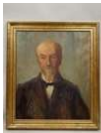
310. Ecole française XXe. Portrait d'homme. Huile sur toile. 65 x 54 cm.