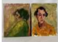
365. Ecole française XXe. Portraits. Deux huiles sur panneau formant pendant. 50 x 40 cm.