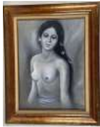
468. PUIG BALI (XXe). Jeune Tahitienne. Huile sur toile signée en bas à droite. 58 x 43 cm.