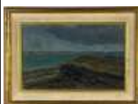
271. Ecole française XXe. Bord de mer. Huile sur panneau. 15 x 23 cm.