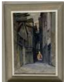
214. Pierre ROBLIN (XXe). La Rue des chats à Troyes. Aquarelle signée et située en bas à gauche, datée 1926 44 x 30 cm.