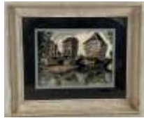
193. G. BIGOT (XXe). Le vieux pont Kreuznach. Fusain et pastel signé en bas à gauche BIG. 21 x 29 cm.