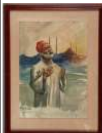
226. O. PETRIDES (début XXe). Turc priant devant Sainte Sophie. Aquarelle signée en bas à gauche et datée 1923. 26 x 18 cm.