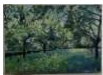
261. Ecole française XIXe. Le verger en fleurs. Huile sur toile. Trace de signature en bas à droite. 32 x 46 cm. (accidents).