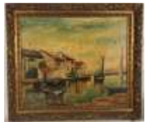
258. Ecole française XXe. Voiliers amarrés à Martigues. Huile sur toile signée en bas à gauche et située en bas à droite. 54 x 65 cm. (accidents).