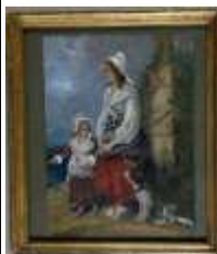
222. Ecole française XIXe. Femme et enfant. Gouache. 29 x 21 cm.