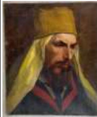
265. Ecole française XXe. Personnage oriental. Huile sur toile. 46 x 38 cm. (accidents restaurations).