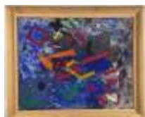
517. Ecole moderne XXIe. Soir de fête. Huile sur toile titrée et datée 90 au dos. 80 x 64 cm.