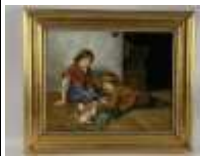
326. J. RANKIN, Ecole française XXe dans le goût du XIXe. Enfants jouant avec les lapins. Huile sur toile signée en bas à droite. 40 x 50 cm.