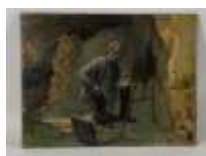
316. École française XXe. Le peintre face à son cheval. Huile sur panneau. Indication manuscrite au dos. 26 x 35 cm.