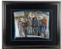
575. Nathalie ROUX (1963-). Les avionneurs. Pastel monogrammé en bas à gauche, titré au dos et daté 2014. 29 x 39 cm.