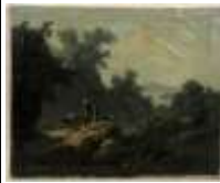
264. Ecole italienne XIXe-XXe. Troupeau et bergers près de la cascade. Huile sur toile. 48 x 59 cm. (petits accidents).