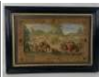
319. Ecole française dans le goût du XVIIe. Scène de chasse au faucon. Huile sur panneau monogrammée RT en bas à droite. 35 x 53,5 cm.