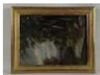
317. P. PAGNIER (XIXe-XXe). Vallée de Noblay. Huile sur toile signée en bas à gauche. 33 x 24 cm. (accidents).