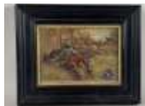
368. MARTIN (XXe). La mort du Poilu. Huile sur panneau signée en bas à gauche, datée 1915. 9,5 x 13,5 cm.