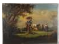
263. Ecole française dans le goût du XVIIIe. La bergère et son troupeau. Huile sur toile. 50 x 81 cm. (restaurations).