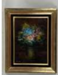
362. PRIETO (XXe). Vase de fleurs. Huile sur toile signée en bas à gauche. 20 x 15 cm.