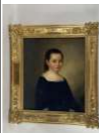
325. Henri BORDEAU (XIXe). Portrait de jeune fille au col de dentelle. Huile sur toile signée en bas à gauche, datée 1885. 56 x 46 cm.