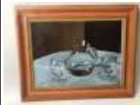
372. Marc DESTORS (XXe-XXIe). La carafe d'eau. Huile sur panneau signée en bas à gauche avec faux-cadre peint. 33 x 41 cm.