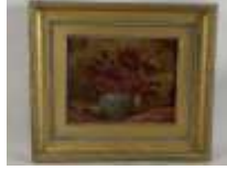
361. Anonyme XXe. Bouquet de xiniyas. Huile sur panneau. 19 x 24 cm.