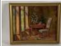
371. Ecole française XXe. Intérieur au bureau. Huile sur carton. 22 x 27 cm.