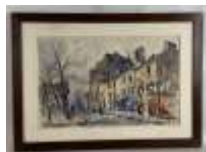
215. Ecole française XXe. Rue du village. Aquarelle. Trace de signature en bas à droite, datée 37. 28 x 45 cm.