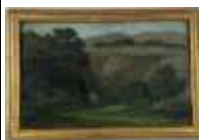
270. Ecole française XXe. Vieille carrière. Huile sur panneau. Trace de signature en bas à droite. 20 x 33 cm.