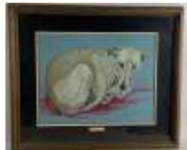
213. G. RENAN (XXe). Pnahab. Pastel signé en bas à droite, titré en marge. 35 x 45 cm.