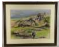
196. Gérard EDAN (XXe). La transhumance. Pastel signé en bas à droite. 42 x 57 cm.