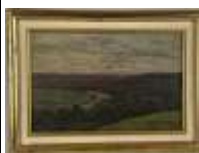
272. Ecole française XXe. Bord de mer. Huile sur panneau. 15 x 23 cm.