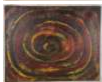
518. Pierre-Marie HELF (XXIe). Composition. Huile sur toile signée et datée 12/01/70 au dos. 92 x 72 cm.