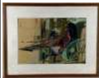
207. Ecole française XXe. Barques à quai. Gouache et aquarelle. Trace de signature non déchiffrée en haut à droite. 49 x 32 cm.