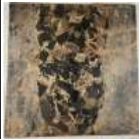
583. Roger MUNIER (XXe-XXIe). Adam. Technique mixte sur panneau. 100 x 100 cm.