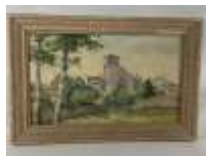
312. B.L. BOURDERY (XXe). Vue d'Eglise. Huile sur toile signée en bas à gauche, située au dos à Couonges-sur-l'Autize. 33 x 55 cm.