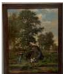
478. C. GEORGET (XXe). Les bûcherons. Huile sur toile signée en bas à droite. 24 x 19 cm. (restaurations).