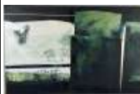
525. Claude TURLAN (XXIe). CHAUM-JA VI. Huile sur toile signée en bas à droite, titrée au dos, datée 1999. 65 x 100 cm.