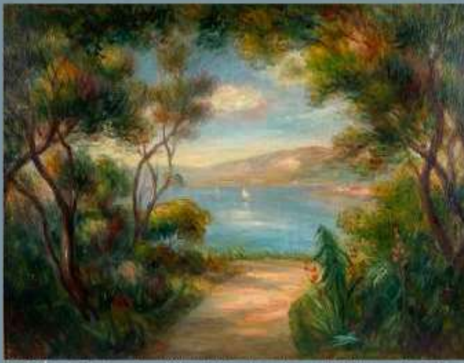
278. École française début XXe dans le goût impressionniste. Paysage sur la baie. Huile sur toile.