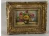
363. Ecole française XIXe. Bouquet de fleurs. Huile sur carton. 10 x 15 cm.