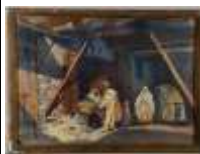
224. Paul FURIET (XIXe-XXe). Dans le souk à Fez. Aquarelle signée en bas à droite, datée novembre 1920. 38 x 53 cm.