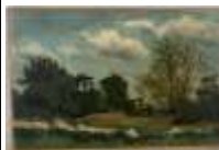
269. Ecole française XXe. Paysage à la barrière. Huile sur toile. 21 x 32 cm.