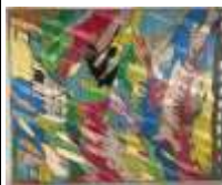
587. Ecole contemporaine XXe. Entre les lignes. Acrylique sur papier monogrammée en bas à droite. 100 x 81 cm. (accidents).