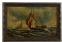
315. Ecole française XXe. Pêcheurs dans la tempête. Huile sur panneau, trace de monogramme en bas à droite. 23 x 37 cm.