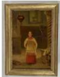
364. Ecole française XIXe. Le Chantre. Huile sur toile. 54 x 37 cm. (restaurations).