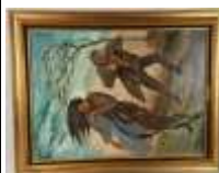
532. Maurice LEMAITRE (XXe-XXIe). Par grand vent. Huile sur toile signée en bas à droite. 81 x 60 cm.