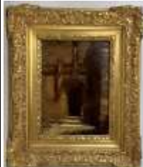
475. Ecole française XIXe. L'entrée de l'église. Huile sur carton portant en bas à droite la signature "E. ISABEY". 24 x 18 cm.