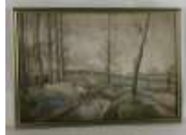
194. C. DELACOMMUNE (XIXe). Rivière dans la campagne. Aquarelle signée en bas à droite, datée 1889. 37 x 55 cm.