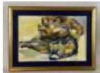
195. Emilia FAURE (née en 1924). Nature morte au pichet bleu. Aquarelle signée en bas à gauche, datée 1956. 30 x 20 cm.