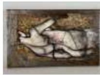
570. CHANCÉ (XXe-XXIe). Nu Technique mixte sur toile marouflée sur tôle d'acier, signée en bas à droite. 32 x 22 cm.