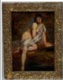
481. Ecole française XIXe. Nu au bain. Huile sur panneau parqueté. 24 x 18 cm.