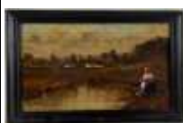
480. Ecole française XXe. Femme au bord de l'étang. Huile sur panneau. Trace de signature en bas à droite. 20 x 35 cm.