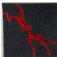
528. Alain MANDON (né en 1967). Stromboli. Technique mixte sur toile, signée, titrée et datée 2016 au dos. Cachet de l'artiste en bas à droite. 70 x 70 cm.