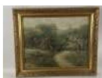
318. L. HENRY (XIXe). La cueillette. Huile sur toile signée en bas à gauche. 43 x 55 cm. (accidents).