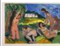
209. Outi PENANEN (1937-). Nu dans les prés à Marly le Roi. Gouache signée en bas à droite située et datée 1986. 50 x 70 cm.