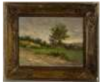
257. Ecole française XXe. Campagne. Huile sur panneau. Trace de signature en bas à droite. 21 x 27 cm.