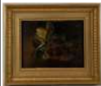
375. École française XVIIIe. Nature morte au tapis et livre ouvert. Huile sur panneau. 26,5 x 20,5 cm. (accidents).