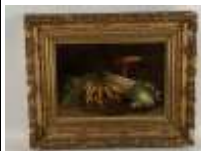
376. Ecole française XXe. Nature morte aux légumes. Huile sur panneau. 30 x 44 cm.