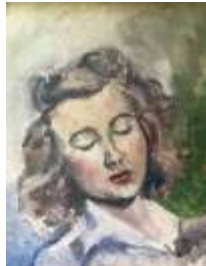
367. H. LUCHAIR (?) (XXe). Portrait de femme. Huile sur toile signée en bas à droite. 41 x 33 cm.