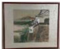
199. Ecole japonnaise XXe. Paysage au lac de montagne. Aquarelle signée en bas à droite. 34 x 37 cm.