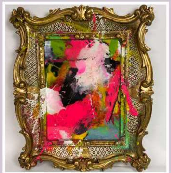
Lot 31 - Anke RYBA