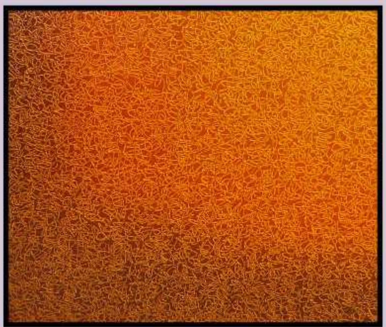
Lot 12 - Eberhard ROSS