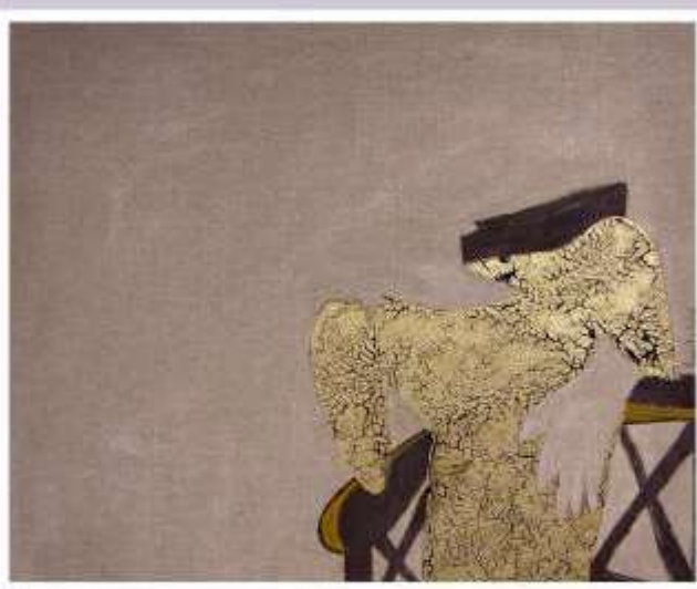
Lot 4 - Angela LAEIR.