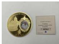
292. Pape FRANCOIS. Médaille cuivre doré.