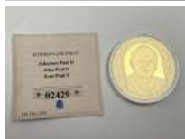
295. Pape JEAN PAUL II avec SWAROVSKI. Médaille cuivre doré.