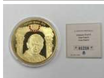
296. Pape JEAN PAUL II. Médaille cuivre doré.