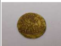
313. ITALIE VENISE (ville de). Ludovic MANIN (1789-1797). Demi-seguinte. 1,72 g. Diam. 19 mm. Réf. Gold coins Friedberg 1446.