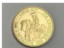
300. ROIS et REINES de FRANCE. Dynastie des Bourbons. LOUIS XIV. Médaille cuivre doré.