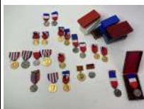
303. Vingt médailles et badges. - Médailles du travail - Chemin de Fer - Confédération musicale et divers. Certaines en argent (8 ex.) et autres en bronze dans leur boîte d'origine pour la plupart.