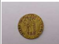
312. ITALIE FLORENCE. Florin d'or au St Jean-Baptiste 1410. Frappé sur un flan régulier de petit diamètre. Type classique avec une grande fleur. Signe : croissant de lune sous un arbre. Bernocchi 2194. Friedberg 276. Or 3,50 g. Diam. 19 mm.