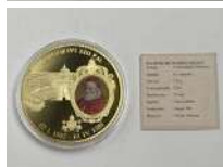
293. Pape GREGOR XIII. Médaille cuivre doré.