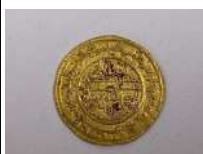
310. Empire ARABE, monde MUSULMAN. (Hispano-musulmane). Andalousie. Dinar d'or Almoravide. Exemplaire sur un flan régulier, bien centré (faiblesses de frappe). Or 3,90 g. Diam. 25 mm.