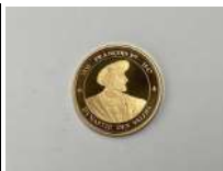
301. ROIS et REINES de FRANCE. Dynastie des Vallois. FRANCOIS 1er. Médaille cuivre doré.