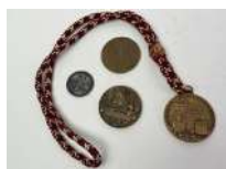
299. Quatre médailles régionales (Touraine). - Commanderie des Grands vins d'Amboise - St Damien / St Come (Paul Métadier). - Crédit agricole mutuel I & L - Médaille en argent (31,60 g) Comice agricole de Tours