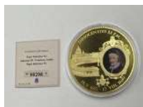
294. Pape INNOCENT XI. Médaille cuivre doré.