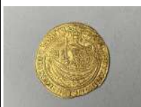
311. Grande-Bretagne, Edouard III (1327-1377). Or. Demi-noble 1361-1369 Londres au titre de Duc d'Aquitaine. Revers E oncial. Diam. 27 mm. Poids : 3,8 g.