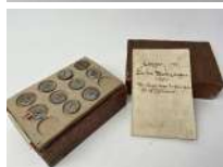
297. Petit médailler ou catalogue d'une collection de 14 plateaux de monnaies antiques (romaines, grecques et diverses) : Env. 161 empreintes en résine et étain fondu. Début XIXe. (moyen pour diffuser des documents tels que les monnaies au XIXe avant la photographie).