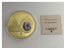
291. Pape BENOIT XVI. Médaille cuivre doré