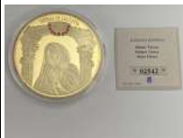
302. TERESE DE CALCUTTA. Médaille VATICAN cuivre doré et swarovski