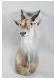
5. Élan du CAP (Taurotragus oryx) (CH) : Tête en cape naturalisée. H. 120 cm.