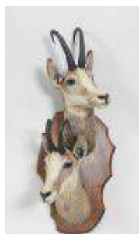
16. Chamois d'Europe (Rupicapra rupicapra) (CH) : Deux têtes en cape naturalisées sur écusson de bois. H.: 83 cm.