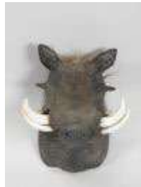
9. Phacochère (Phacochoerus aethiopus) (CH) : Tête naturalisée en cape. H.: 43 cm. (usures).