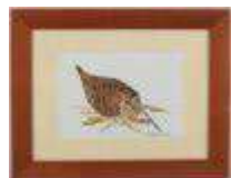
130. VALETTE (XXe). Bécasse. Aquarelle, signée en bas à droite et datée 96. 11 x 16 cm à vue.