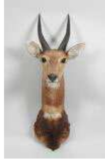
2. Guib harnaché (Tragelaphus scriptus) (CH) : tête en cape. H.: 80 cm.