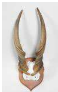
11. Élan du CAP (Taurotragus oryx) (CH) : Massacre sur écusson de bois. H.: 83 cm.