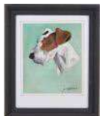
129. J. RIVET (XXe). Chien. Gouache sur tissu signée en bas à droite. 21,5 x 18 cm.