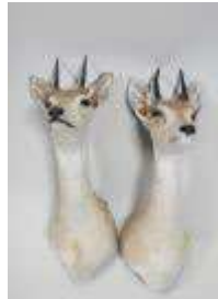
10. Oribis (Ourebia Ourebi) : Deux têtes en cape naturalisées. H.: 41 cm.