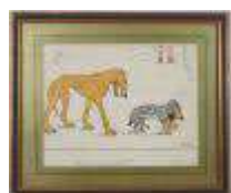
128. Maurice OGER (XXe). Amour sans espoir? Aquarelle, signée et contre signée avec envoi. 19 x 23 cm à vue.