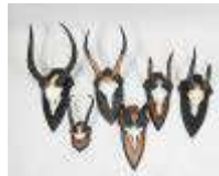
12. Lot de six massacres sur écusson de bois dont animaux d'Afrique et divers. H. max : 60 cm.