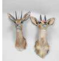
3. Dik-dik spp (Madoqua spp) (CH) : Deux têtes en cape. H.: 42 cm. (usures).