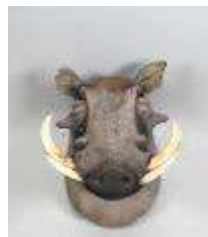
1. Phacochère (Phacochoerus aethiopus) (CH) : Tête naturalisée en cape. H.: 45 cm. (usures).