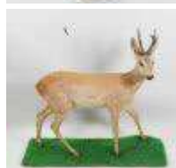
17. Chevreuil d'Europe (Capreolus capreolus) (CH) : Brocard naturalisé en pied. 102 x 106 x 33 cm.