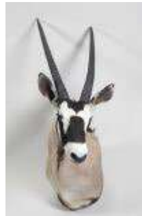
6. Oryx gazelle (Oryx gazella) (CH) : Tête en cape naturalisée. H. 105 cm.