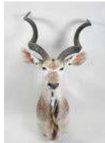
4. Grand koudou (Tragelaphus strepsiceros) (CH) : Tête en Cape naturalisée. H. 130 cm. Larg.: 75 cm. (usures).