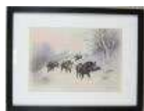
126. Georges TISSET (XXe). Compagnie de sangliers. Techniques mixtes, signée en bas à droite. 20 x 28,5 cm.