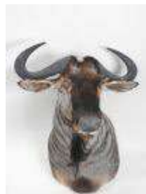
7. Gnou bleu (Connochaetes taurinus) (CH) : Tête en cape naturalisée. H.: 70 cm. Larg.: 64 cm.